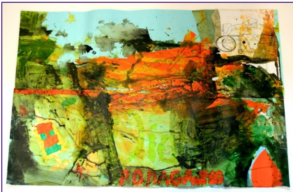
Teja Grobelnik Šolski center Slovenj Gradec – Srednja zdravstvena šola