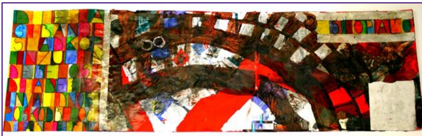
Sara Caf Srednja zdravstvena in kozmetična šola Maribor